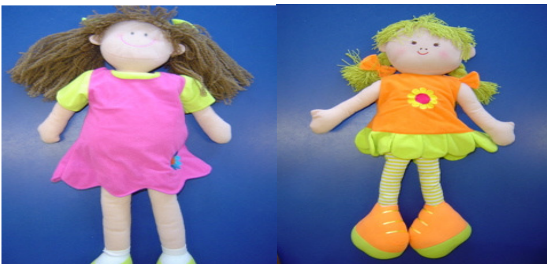
La María parla en castellà