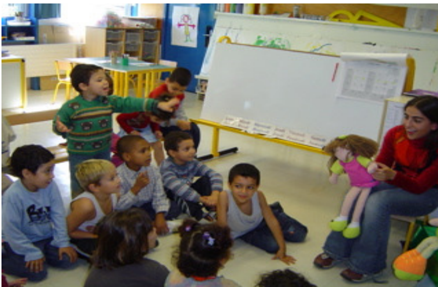
La Laia parla en català